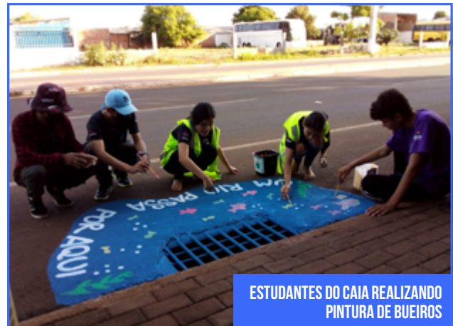
ESTUDANTES DO CAIA REALIZANDO PINTURA DE BUEIROS

A equipe de Educação Ambiental promoveu palestras em cinco Escolas Municipais, um Centro de Educação Infantil e em um Centro de Atenção Integral ao Adolescente, além de promover e acompanhar a pintura de bueiros, atingindo um público estimado de 611 alunos. Em Foz do Iguaçu, mais de 50 bueiros foram pintados.