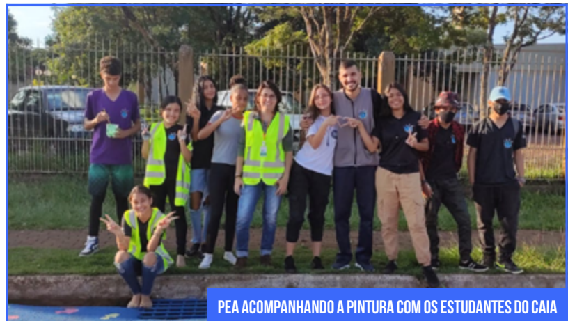
PEA ACOMPANHANDO A PINTURA COM OS ESTUDANTES DO CAIA