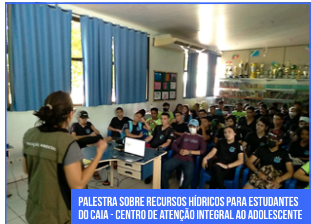
PALESTRA SOBRE RECURSOS HÍDRICOS PARA ESTUDANTES DO CAIA - CENTRO DE ATENÇÃO INTEGRAL AO ADOLESCENTE