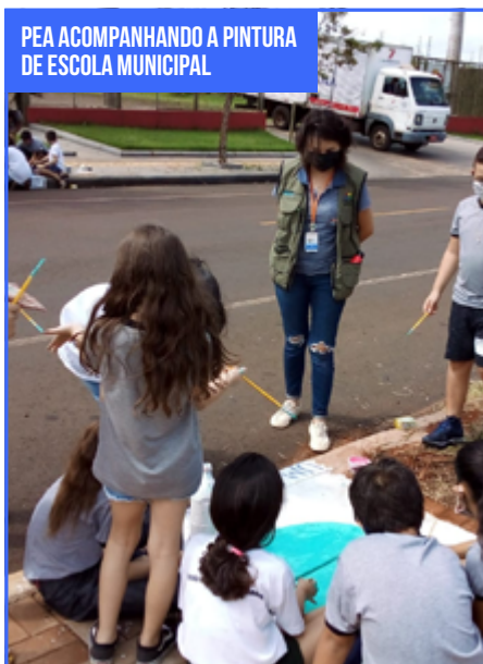
PEA ACOMPANHANDO A PINTURA DE ESCOLA MUNICIPAL