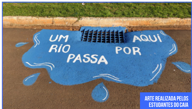
ARTE REALIZADA PELOS ESTUDANTES DO CAIA