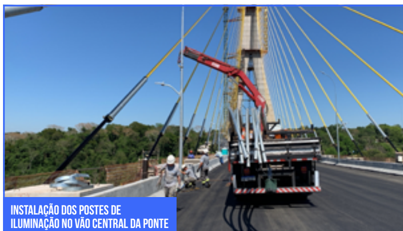
INSTALAÇÃO DOS POSTES DE ILUMINAÇÃO NO VÃO CENTRAL DA PONTE

No presente mês, foram iniciadas as atividades de instalação das vias de rolamento das Plataformas de Inspeção e Manutenção no vão central da Ponte. Assim como, deram início aos trabalhos finais das ancoragens passivas, instaladas na Câmara de Estais em ambos os mastros, Brasil e Paraguai.