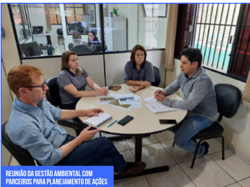
REUNIÃO DA GESTÃO AMBIENTAL COM PARCEIROS PARA PLANEJAMENTO DE AÇÕES

Grandes obras de infraestrutura como a implantação da segunda ponte internacional entre o Brasil e o Paraguai, rodovia de acesso e aduanas, passam por um processo de licenciamento ambiental, a fim de viabilizar sua implantação. O licenciamento ambiental, previsto na Política Nacional de Meio Ambiente, Lei 6.938/1981, é um processo administrativo fundamentado por estudos técnicos, que dentre outras demandas, prevê medidas de controle e mitigação de potenciais impactos ambientais.