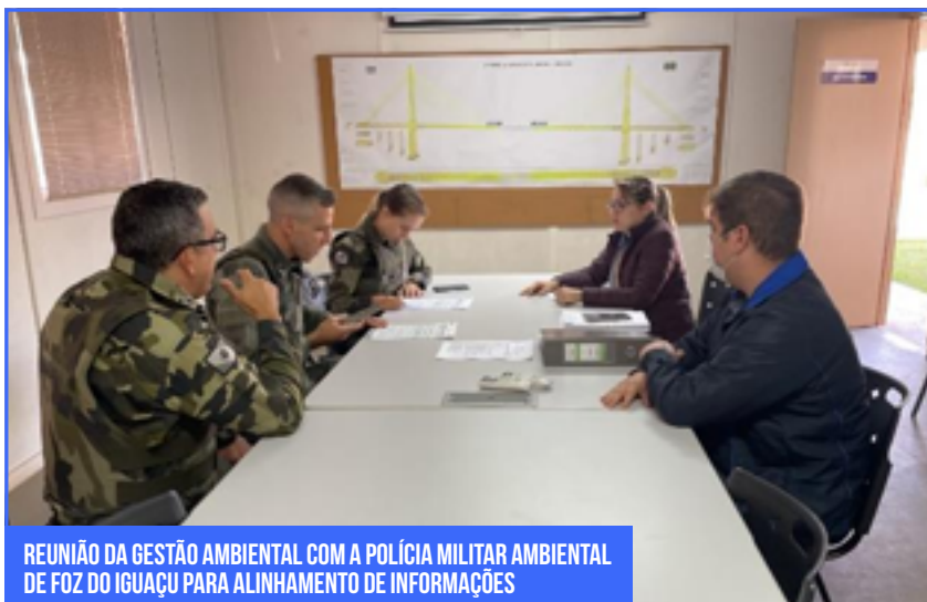
REUNIÃO DA GESTÃO AMBIENTAL COM A POLÍCIA MILITAR AMBIENTAL DE FOZ DO IGUAÇU PARA ALINHAMENTO DE INFORMAÇÕES