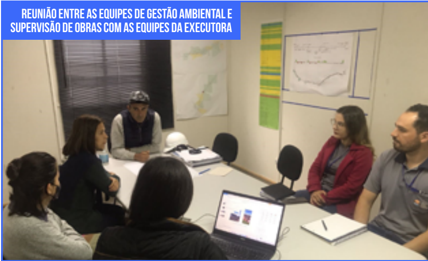
REUNIÃO ENTRE AS EQUIPES DE GESTÃO AMBIENTAL E SUPERVISÃO DE OBRAS COM AS EQUIPES DA EXECUTORA