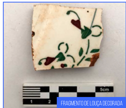
FRAGMENTO DE LOUÇA DECORADA