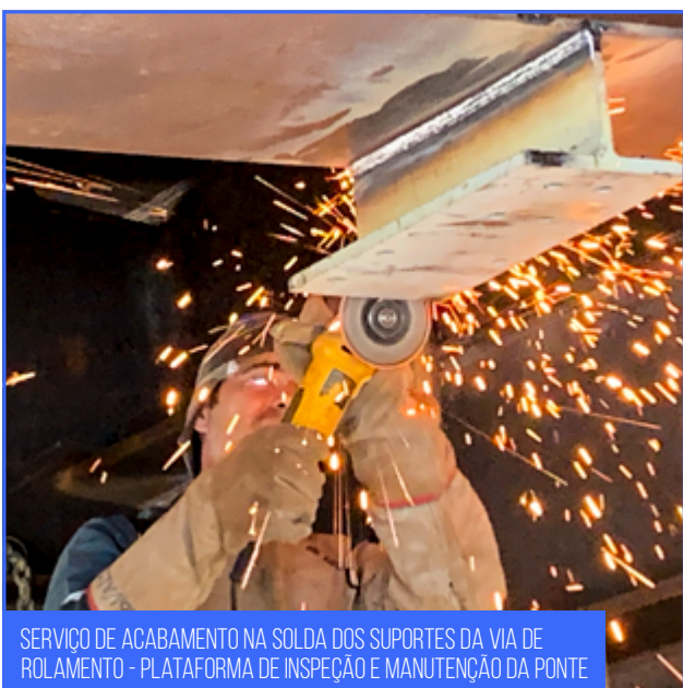
SERVIÇO DE ACABAMENTO NA SOLDA DOS SUPORTES DA VIA DE ROLAMENTO - PLATAFORMA DE INSPEÇÃO E MANUTENÇÃO DA PONTE