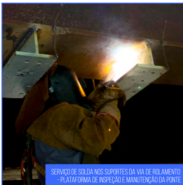
SERVIÇO DE SOLDA NOS SUPORTES DA VIA DE ROLAMENTO - PLATAFORMA DE INSPEÇÃO E MANUTENÇÃO DA PONTE