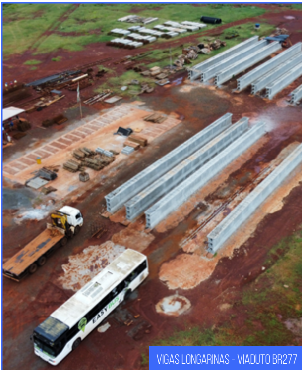
VIGAS LONGARINAS - VIADUTO BR277