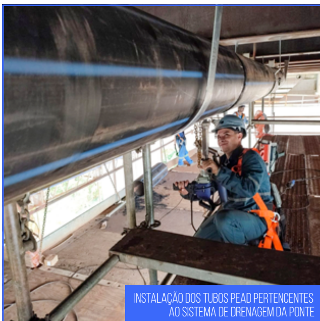
INSTALAÇÃO DOS TUBOS PEAD PERTENCENTES AO SISTEMA DE DRENAGEM DA PONTE