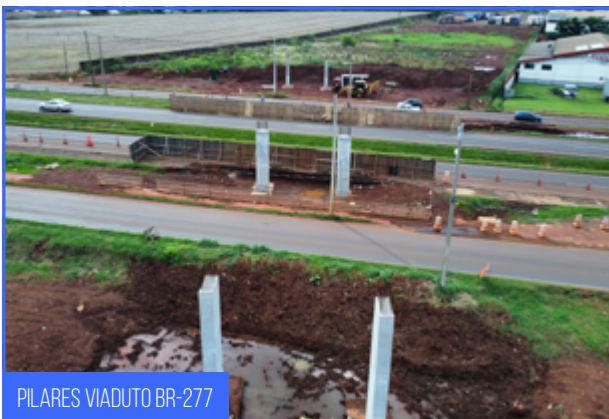
PILARES VIADUTO BR-277

Os serviços de drenagem estão sendo executados na Aduana Paraguaia e ao longo da Linha Geral, dando continuidade nas caixas e alas de bueiros e também, aos drenos subsuperficiais e profundos.