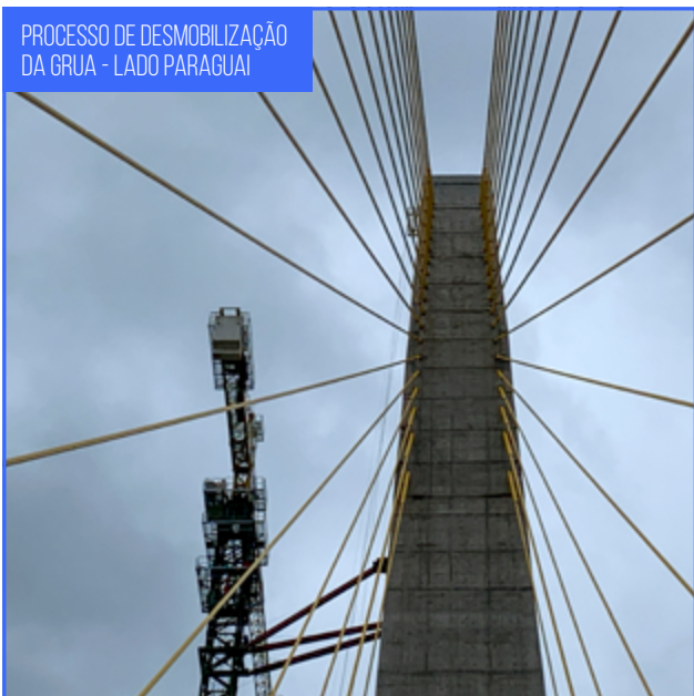
PROCESSO DE DESMOBILIZAÇÃO DA GRUA - LADO PARAGUAI