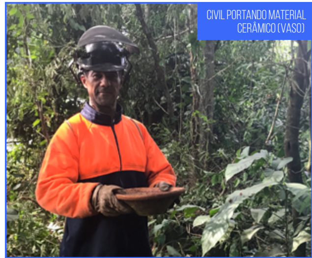
CIVIL PORTANDO MATERIAL CERÂMICO (VASO)

No entanto, no transcorrer do Programa de Monitoramento Arqueológico, foi identificado um quarto sítio arqueológico na ADA do acesso, durante atividade de raspagem de expurgo. O sítio caracterizado pela presença de concentração de fragmentos cerâmicos da tradição arqueológica Tupiguarani foi denominado de sítio Porto Guarani, o qual também passou por atividades de salvamento arqueológico.