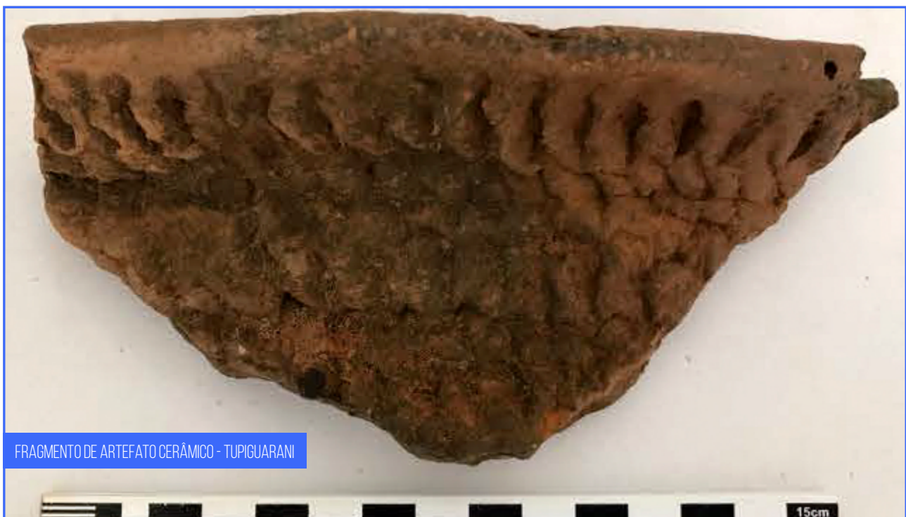
FRAGMENTO DE ARTEFATO CERÂMICO - TUPIGUARANI