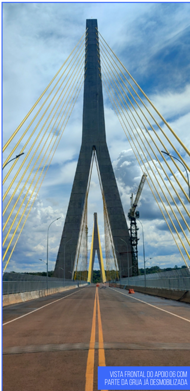
VISTA FRONTAL DO APOIO 06 COM PARTE DA GRUA JÁ DESMOBILIZADA