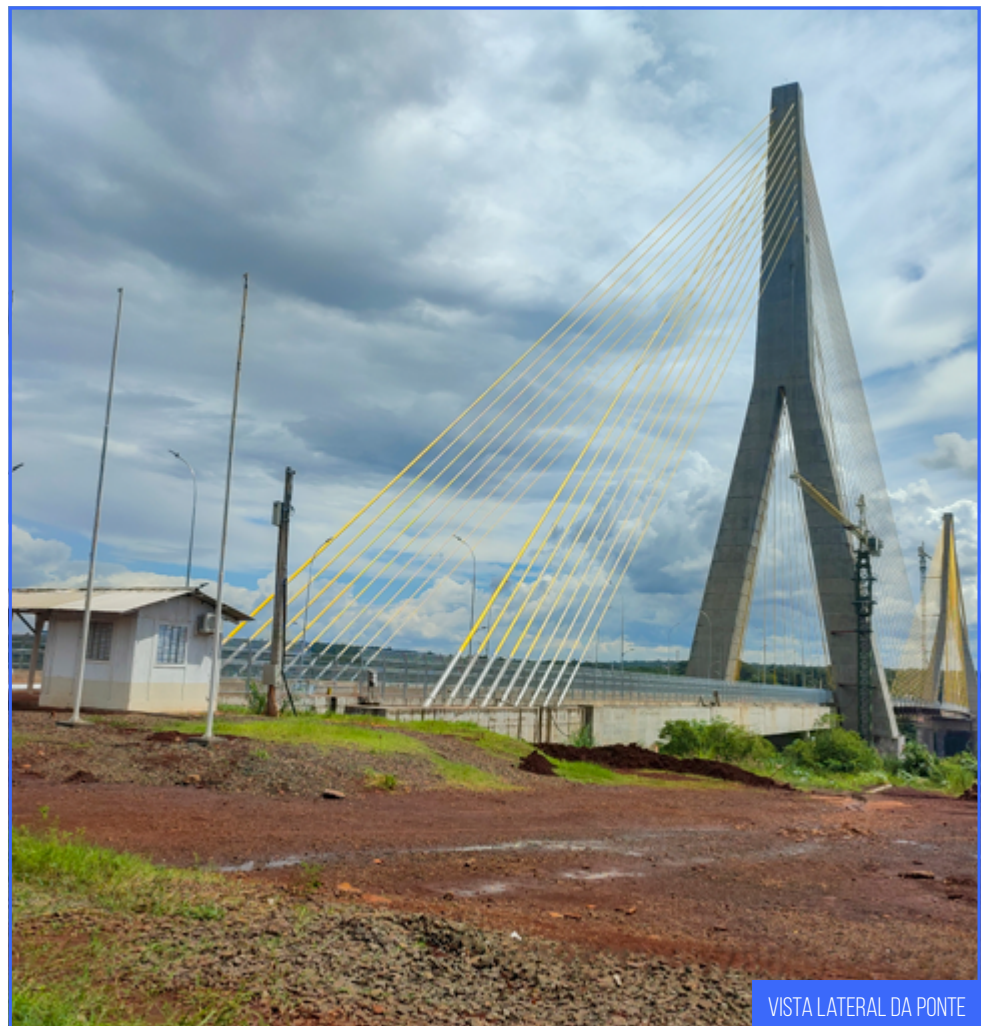
VISTA LATERAL DA PONTE