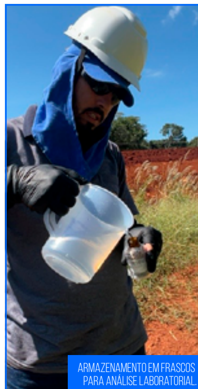
ARMAZENAMENTO EM FRASCOS PARA ANÁLISE LABORATORIAL.