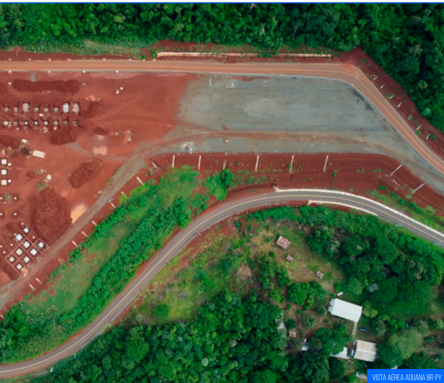
VISTA AÉREA ADUANA BR-PY

ATÉ O MOMENTO CERCA DE 24,64% DA OBRA FOI EXECUTADA, COM INVESTIMENTO DE APROXIMADAMENTE 33,73 MILHÕES DE REAIS