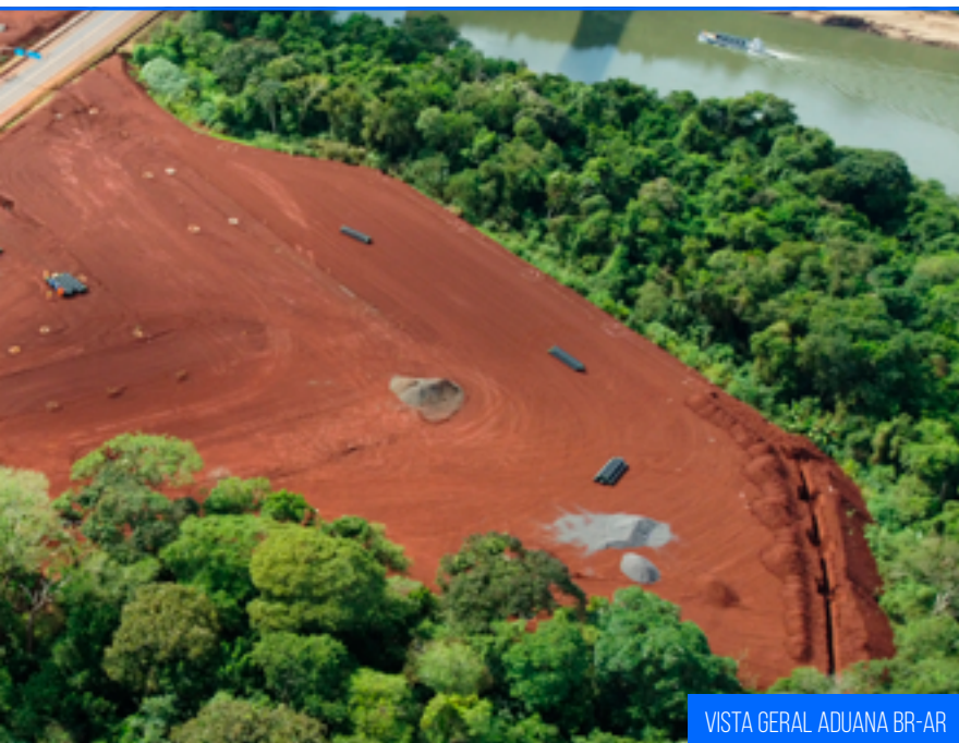
VISTA GERAL ADUANA BR-AR

Na futura instalação da Aduana Brasil - Argentina os serviços de terraplenagem estão em execução. Ademais, das 600 estacas raiz da fundação das bases da estrutura do edifício da aduana 100 já constam finalizadas. Concomitantemente as drenagens do platô da Aduana continuam em execução.