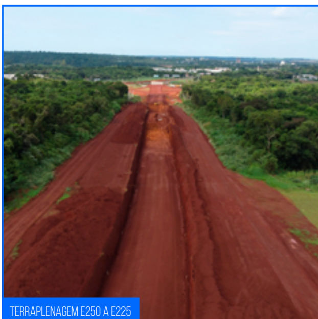
TERRAPLENAGEM E250 A E225

Foram iniciados os serviços de pavimentação na linha geral, entre as ruas Ruas Carlos Hugo Urnau e Francisco Fogaça do Nascimento com a execução da camada de sub-base de rachão.