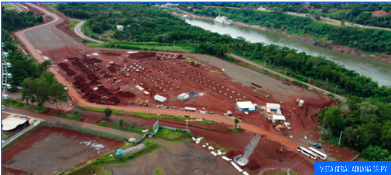
VISTA GERAL ADUANA BR-PY