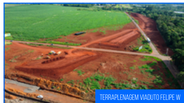
TERRAPLENAGEM VIADUTO FELIPE W

Em março de 2024 as obras do Acesso à Ponte da Integração seguem em ritmo acelerado. As frentes de serviços de terraplenagem estão concentradas entre a Interseção da Rodovia BR469 e nas proximidades da Avenida República Argentina, com destaque para a execução dos aterros de acesso a futura Obra de Arte Especial (OAE) na interseção da Avenida Maria Bubiak com a Avenida Filipe Wandscheer. O volume executado de corte e aterro foi de aproximadamente 40.000m 3 .