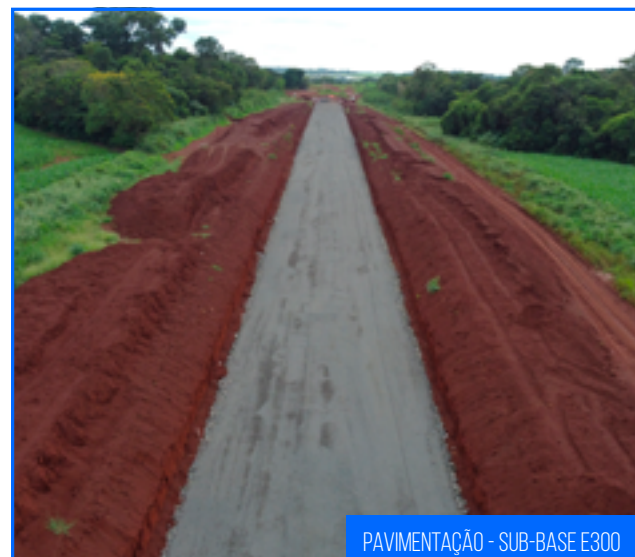
PAVIMENTAÇÃO - SUB-BASE E300