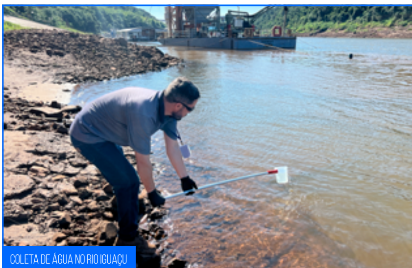
COLETA DE ÁGUA NO RIO IGUAÇU

O presente monitoramento efetiva-se na periodicidade trimestral. Em relação aos corpos hídricos, dentre as medidas mitigadoras estão a criação de canteiros e o monitoramento dos efluentes gerados, barreiras de contenção em corpos hídricos para evitar o carreamento de materiais, gestão de resíduos e o controle de erosões. Todas estas medidas devem estar em cumprimento com a legislação.