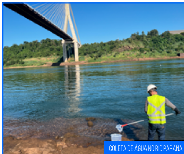
COLETA DE ÁGUA NO RIO PARANÁ

O monitoramento consiste na coleta de 11 amostras em 8 pontos específicos sugeridos pelo Plano Básico Ambiental e estabelecidos pela resolução CONAMA 357/2005, este por sua vez descreve quais parâmetros devem ser analisados, tendo como indicadores variáveis de natureza física, química e biológica.