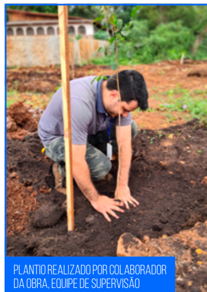
PLANTIO REALIZADO POR COLABORADOR DA OBRA, EQUIPE DE SUPERVISÃO