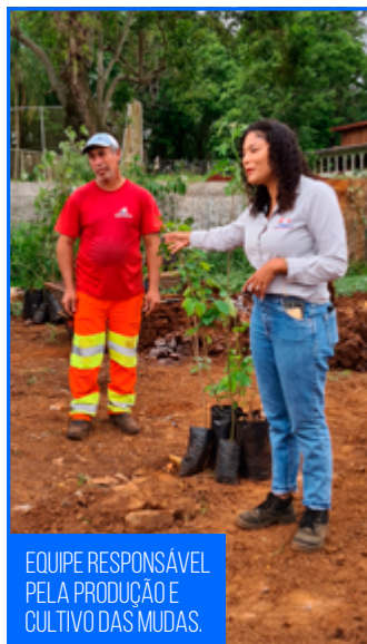
EQUIPE RESPONSÁVEL PELA PRODUÇÃO E CULTIVO DAS MUDAS.

Em setembro, no dia 21, é comemorado o Dia da Árvore, essa data remete sobre a necessidade da conscientização de todos sobre a preservação do meio ambiente.