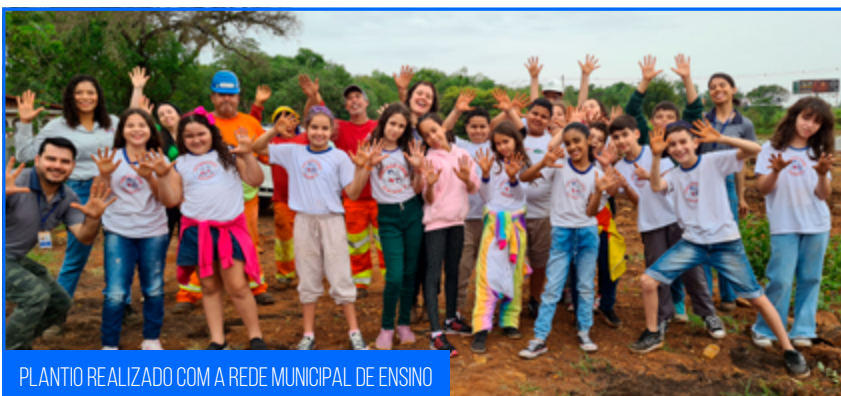
PLANTIO REALIZADO COM A REDE MUNICIPAL DE ENSINO

Nesse contexto, são realizadas atividades de Educação Ambiental, envolvendo os colaboradores da obra e a comunidade local, a fim de mostrar a importância e a responsabilidade de cada um nesse processo, promovendo a mudança de comportamento em relação ao tema.