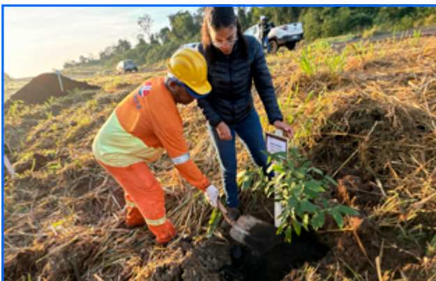
PLANTIO REALIZADO POR COLABORADOR DA OBRA, EQUIPE DE EXECUÇÃO

Durante as atividades de supressão de vegetação, são coletadas sementes e plântulas de indivíduos da vegetação nativa, a fim de garantir a preservação das espécies.