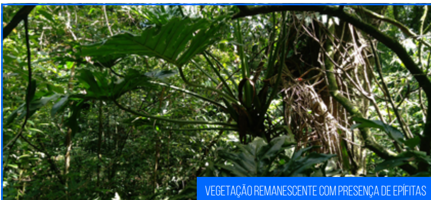
VEGETAÇÃO REMANESCENTE COM PRESENÇA DE EPÍFITAS