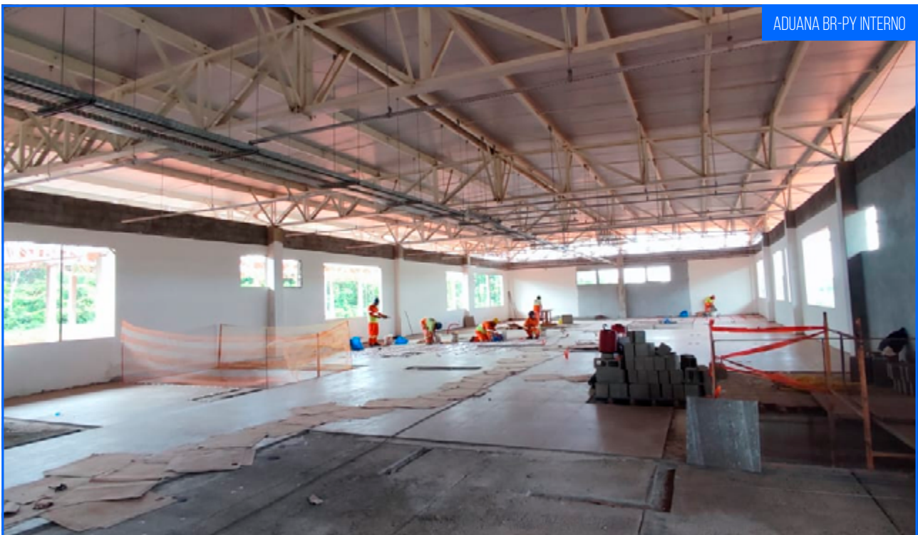
ADUANA BR-PY INTERNO

As obras na aduana Brasil -Paraguai avançam de forma expressiva e em múltiplas frentes. No edifício administrativo, já foram iniciados os acabamentos internos, incluindo o revestimento com porcelanato nos pisos do 1º pavimento e a preparação das paredes com reboco no pavimento térreo.